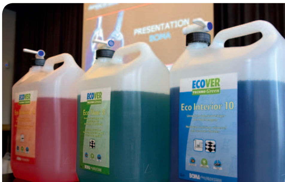
Ecover: duurzaam vanaf de oorsprong van grondstoffen tot en met de afbraak van eindproducten.

Tenslotte gaan Bresseleers en Tops in op het thema van de dag. Hoe kunnen schoonmaakbedrijven ecologisch schoonmaken ‘verkoppen’ aan hun klanten. Belangrijk